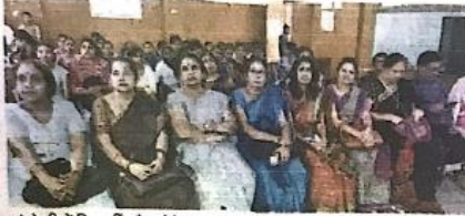
संगोष्ठी में विद्यार्थी और प्रोफेसर।